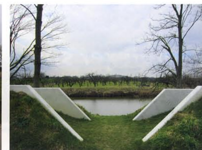
Zicht op het omliggende landschap.

op het Werk. Er heerst trots en een gevoel van mede-eigenaarschap. Maar ondanks het succes en het intensieve gebruik, roept de hoge esthetische waarde van het plan bij een aantal bezoekers ook weerstand op. Het ziet er allemaal gelikt uit. Aan elke vierkante centimeter is ontworpen. Niets is onberoerd gebleven. Dat maakt het plan bij velen museaal en afstandelijk – haast een maquette. Er is een strakke beeldregie. De kunstenaar kreeg met moeite toestemming voor een glaspui in de gevel van het bomvrije gebouw, haar atelier. De genieloods is prachtig gerenoveerd, maar scheidt door zijn smetteloosheid ook afstand. De karrensporen ogen speels, maar zijn met wiskundige precisie aangelegd en werken soms vervreemdend. De grastaluds zijn strak en steil, maar zijn ook kwetsbaar en worden snel kapot gelopen. Met andere woorden, past dit verfijnde vergaande ontwerp bij deze 'doe-plek'? Had het informeler of terughoudender gekund?