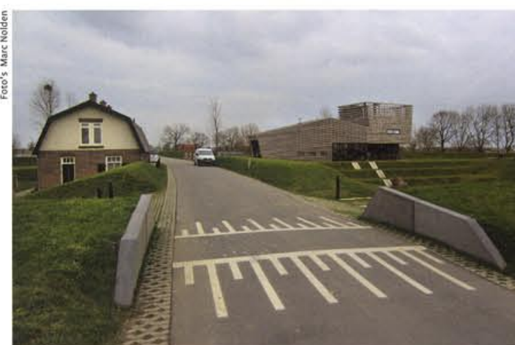
Entree vanaf de Lekdijk.