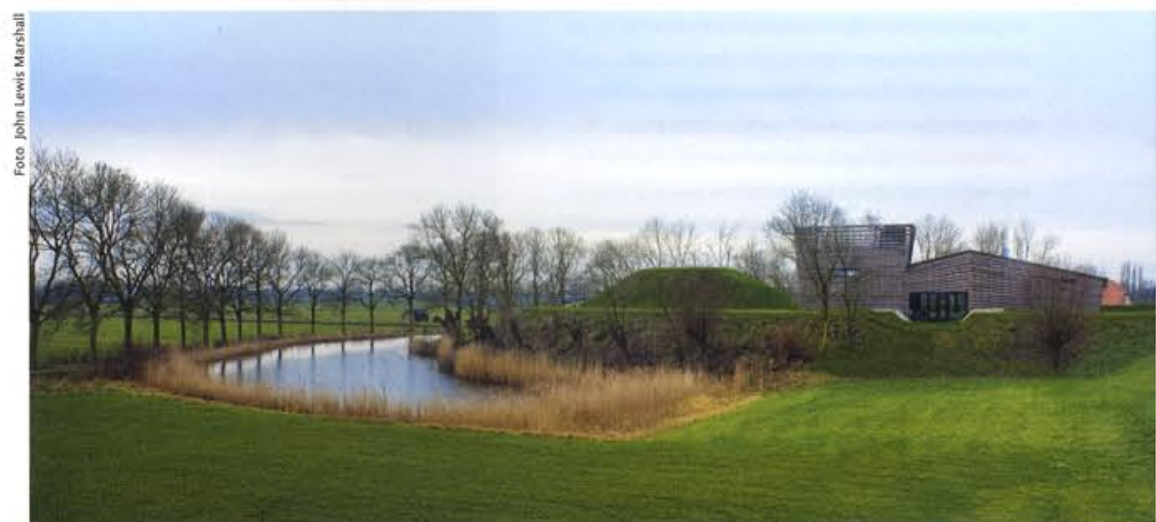
Zicht op Fort Werk aan 't Spoel vanuit het oosten.