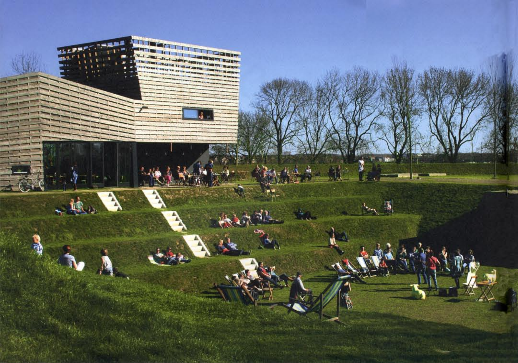
Het Forthuis en het druk gebruikte amfiteater.

dat op deze afstand van pallets lijkt gemaakt. Dit is het Forthuis. Eromheen staan bomen. Als je vlakbij bent snijdt de asfaltweg door een dijklichaam van een meter hoog en opent zich aan beide kanten van de weg een ruimte tussen de bomen. Je komt echt ergens binnen, ook al loopt de asfaltweg van de dijk onverstoord door. Deze ruimte lijkt één grote grassculptuur, bestaande uit rechte lijnen, kuilen, bulten en lijnen. Het geheel is omzoomd door een dijklichaam dat aan de buitenzijde beplant is met essen. Daaromheen liggen water en een tweede ring van essen met een wandelpad erlangs, dat aantakt op andere routes door de uiterwaarden en het binnenveld.