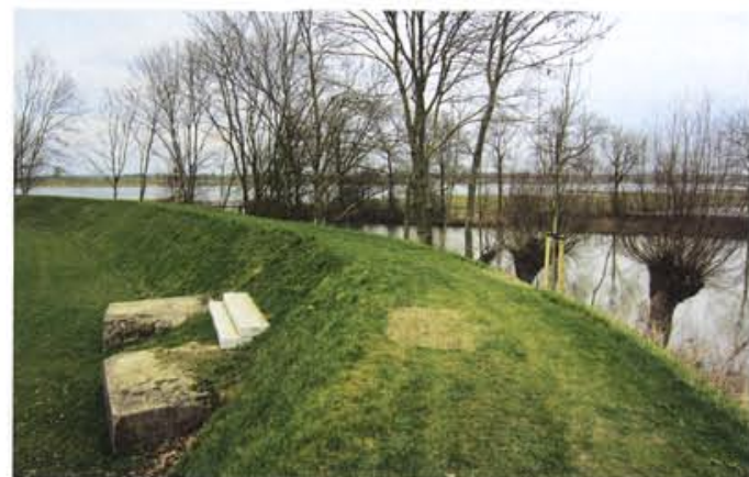
Dijklichaam met steile taluds omsluit het Fort.