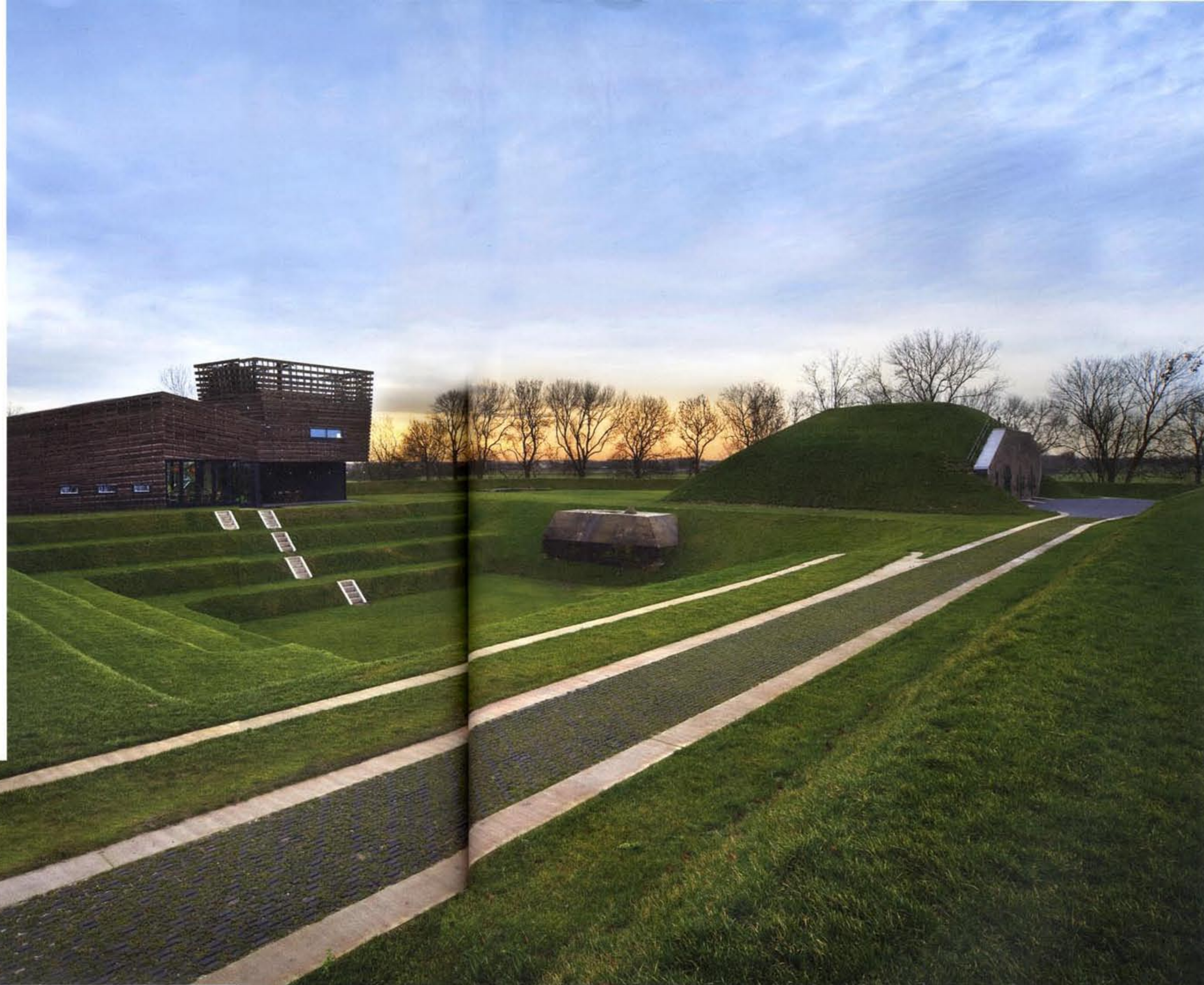
Fort Werk aan het Spoel.