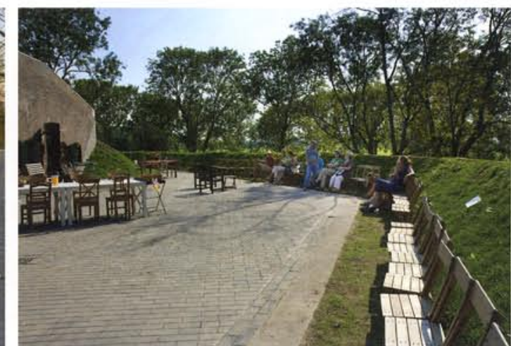
Evenement bij een 'bomvrij' gebouw.