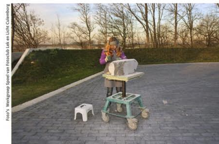
Kunstenaar aan het werk.