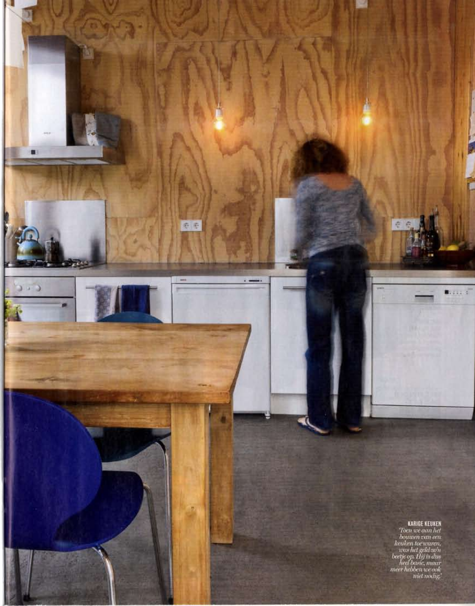
KARIGE KEUKEN 'Toen we aan het bouwen van een keuken toevaren, was het geld zo'n beetje op. Hij is dus heel basic, maar meer hebben we ook niet nodig.'