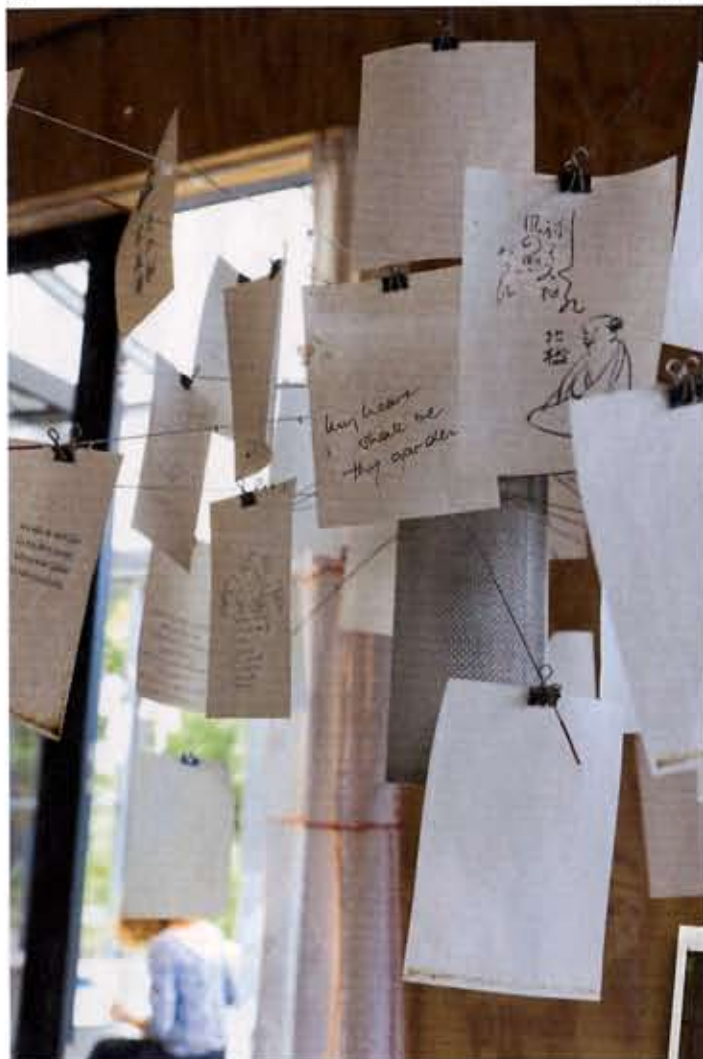
BRIEFJESLAMP De Zettel-lamp is een bekend ontwerp van ontwerper Ingo Maurer. Op de A-5jes van Japans papier staan romantische spreuken in allerlei talen. 'We hebben de echte.'