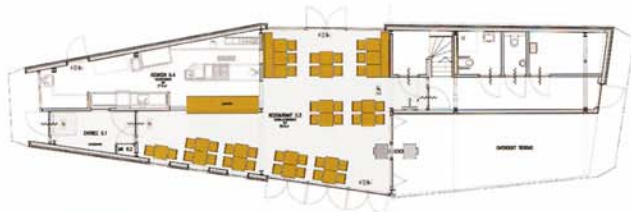
LAAG 0 | RESTAURANT