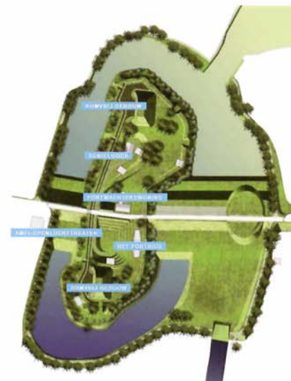
TEKENING: STICHTING WERK AAN HET SPOEL, CULTUURBOURG

geopend en gesloten. Via het spoel werd de Goilberdingwaard met water uit de naast stromende Lek geïnundeerd. Het werk wordt doorsneden door de Goilberdingerdijk tussen Culemborg en Everdingen (Fort Everdingen). In 1879 zijn er twee bomvrije gebouwen geplaatst. De waaiersluis is in 1978 gesloopt.