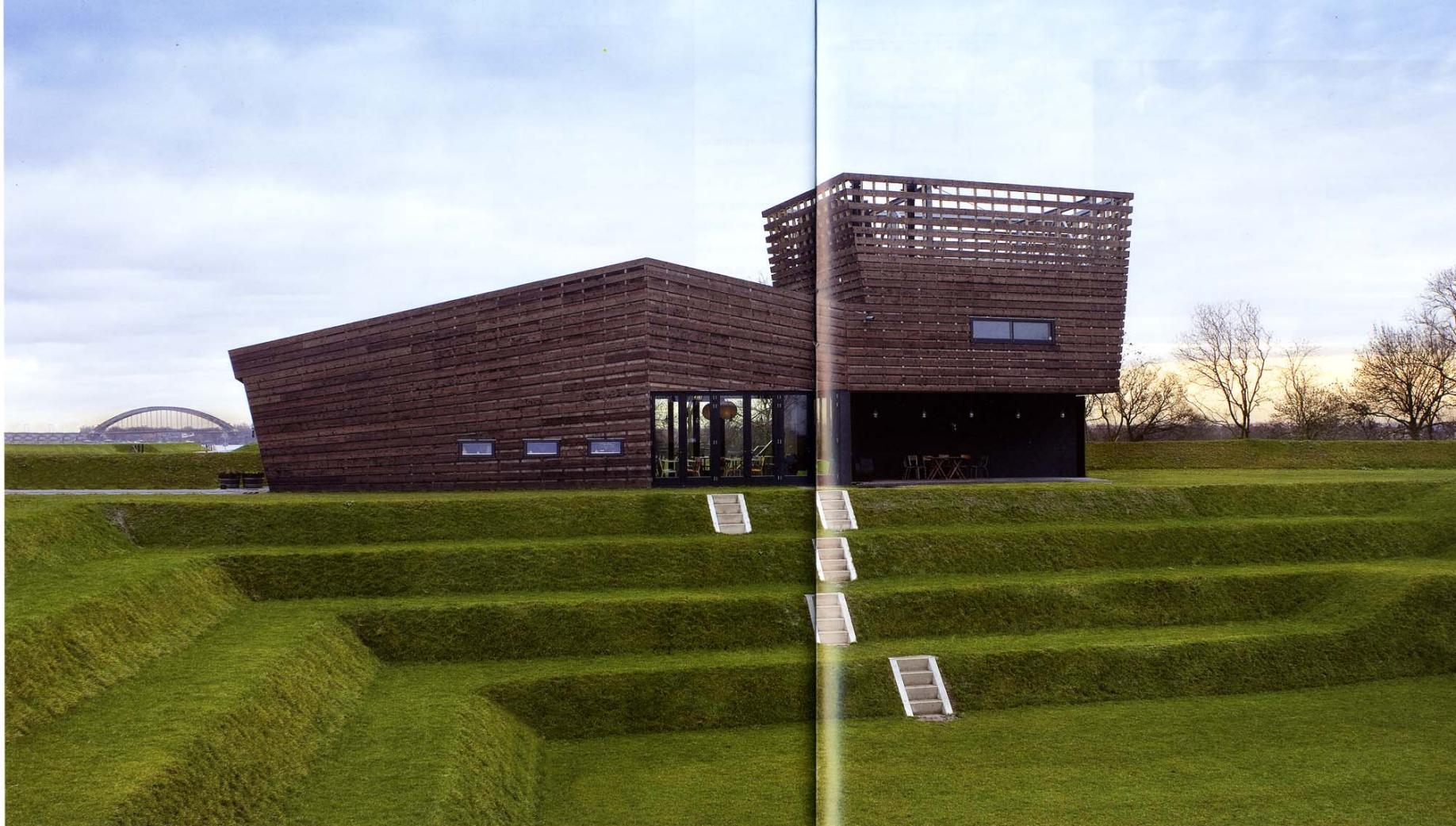
Optisch bedrog: van een afstand lijken de linker geveldelen in een hoek naar voren springen.