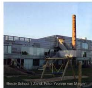
Brede School 't Zand.

deelgebied heeft een eigen architectonische signatuur – is een bijzondere kwaliteit. En we hebben natuurlijk een heel bijzonder park, het Máximapark, en – straks – een nieuw stadscentrum. Deze twee ankerpunten zorgen voor eenheid in een grote verscheidenheid van deelgebieden. Eenheid geeft ook de tijd waarin Leidsche Rijn is en wordt gebouwd, circa 25 jaar. Het stadsdeel – en dat zou je als punt van kritiek kunnen zien – is tot nu toe snel gebouwd – met als mogelijk nadeel dat wel heel prominent één enkel tijdsgewricht in het gebied present is. Toch oogt het in mijn ogen niet zo. Leidsche Rijn is weliswaar snel gebouwd, maar – nogmaals – elk deelgebied heeft toch zijn eigen signatuur gekregen."