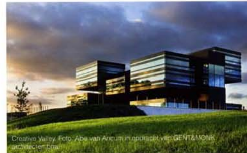
Creative Valley.

"Voor de crisis bouwden we in Leidsche Rijn 2.000 woningen per jaar. In 2010 zijn nog geen 1.000 ►