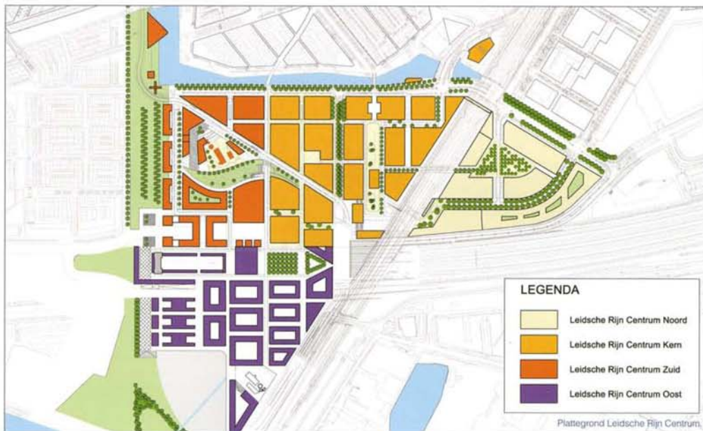
Plattegrond Leidsche Rijn Centrum.