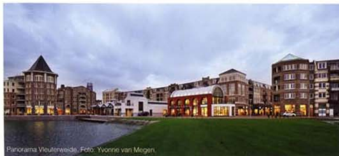
Panorama Veulterweide.

Noten 1. Jaarboek Landschapsarchitectuur en Stedebouw in Nederland 97-99, p. 90, 73den.