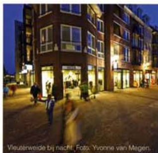
Veulterweide bij nacht.