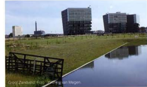
Groot Zandveld.