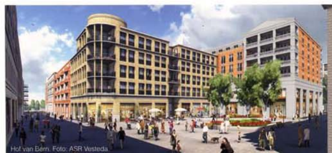
Hof van Bèrn.